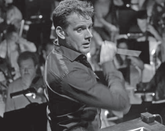
L'Opéra - Jean-Stéphane Bron

propriétaires victimes, les courtiers, qui étaient manipulés par les banques, révèlent et dénoncent le système de spoliation : les dupés d'hier retrouvent ainsi leur dignité.